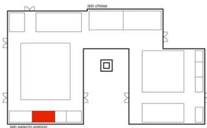
pianta del padiglione